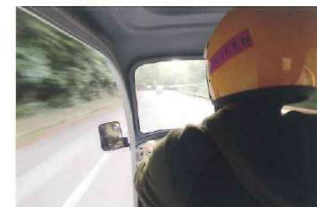
快適に走る AP トライク。後部座席からの風景