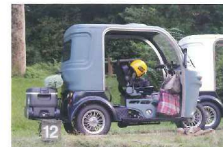
荷物いっぱい積み込みキャンプも楽しめます