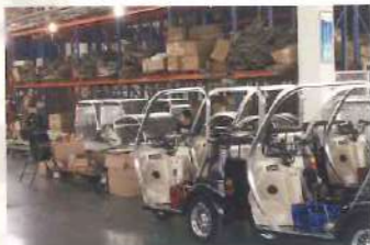
生産工場・組み立て