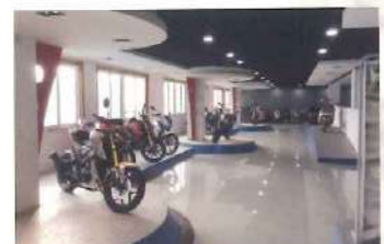
APtrikes 125 生産工場・ショールーム

中国にある大手バイクメーカーにてオリジナル車両として生産、認証を取っております。 こちらのバイクメーカーは非常に多くの実績が御座いますのでご安心下さい。 ※弊社は日本販売契約を結び、国内を中心に販売しております。