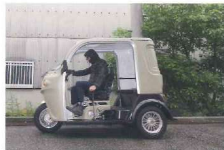
APtrikes125はしっかりと車体を覆う屋根付きで雨の日もバイクより快適に運転頂けます。雨天時の使用を避けられない配達業務などにも安定したご利用を頂けるのが APtrikes125 の良いところ◎

APtrikes125は バイクとクルマのいいとこどり 普通自動車免許で運転可 保険・税が安く、車検や車庫証明が不要です