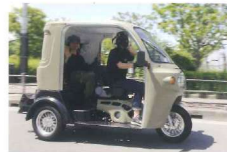
最大3人乗りが可能なAPtrikes125はちょっとした送迎などに非常に便利です。また後部座席を利用した荷物の運搬などにも役立ちます。