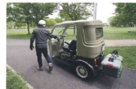
手押しでも比較的簡単に動かせることが可能です